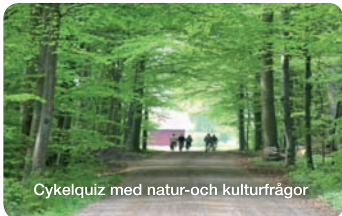
Cykelquiz med natur-och kulturfrågor

Vi föreslår gärna aktiviteter för Er vistelse och är lyhörda för Era önskemål. Kanske kan något av nedanstående passa?